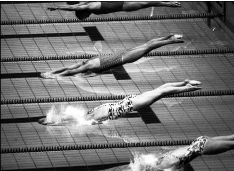
La partenza di una gara di nuoto femminile alle Olimpiadi di Montreal del 1976

La carne del poeta espone più crude- ra una stas nutrita di vitamine, crede-